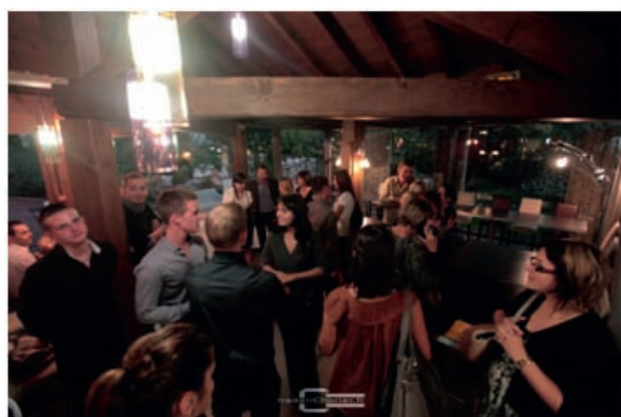
REMISE DES DIPLÔMES MANAGER D'UNIVERS MARCHAND 2011

→ Effectif : 7 → Chiffre d'affaires : NC → Année de création : 1997