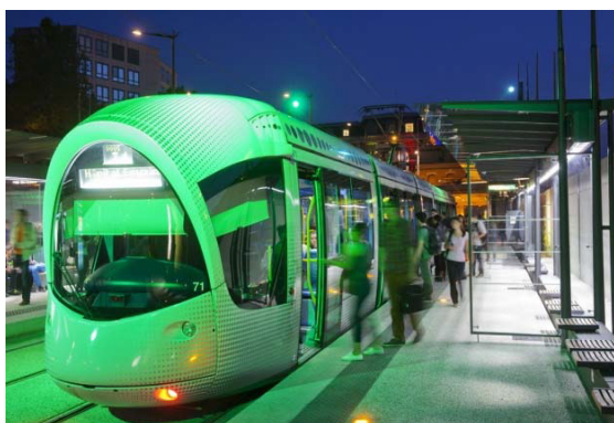
TRAMWAY DE GRENOBLE 1

→ Effectif : 135 → Chiffre d'affaires : 26 000 000€ → Année de création : 1979