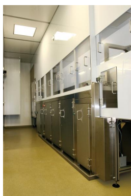
NETTOYAGE D'IMPLANTS, ANCILLAIRES, ... POUR LE MÉDICAL