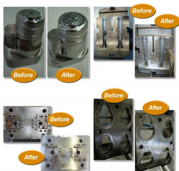
NETTOYAGE DE MOULES PAR ULTRASONS

→ Effectif : 4 → Chiffre d'affaires : 5 500 000€ → Année de création : 1981