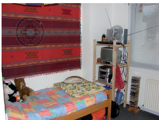
CHAMBRE INDIVIDUELLE POUR ÉTUDIANTS