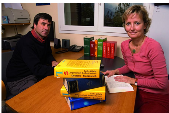
L'ÉQUIPE ADMINISTRATIVE D'ADELINK

→ Effectif : 2 → Chiffre d'affaires : 260 000€ → Année de création : 1998