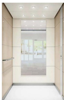
MONOSPACE 500 VERSION CLASSIQUE