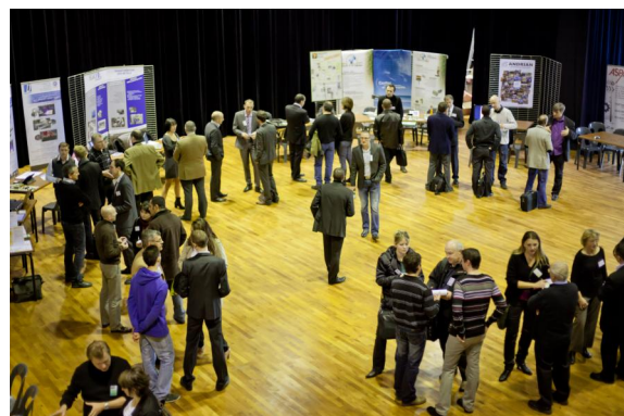
SPEED MEETING organisé à Savoie Technolac et animé par 1'PULSER

Dans le monde des affaires, on parle souvent de B to B, de B to C... Chez 1'Pulser nous parlons de H to H, de relation d'homme à homme, d'individu à individu.