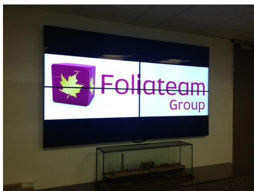
MISE EN PLACE D'UNE SOLUTION D'AFFICHAGE DYNAMIQUE

→ Effectif : 7 → Chiffre d'affaires : 40 000 000€ → Année de création : 1971