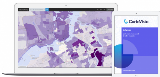
CartoVista Affaires | Solution d'affaires et d'analyses de données assurant la rentabilité des entreprises, organisations et gouvernements.

→ Effectif : 1 → Chiffre d'affaires : NC → Année de création : 2010