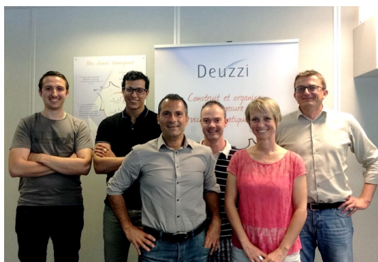
EQUIPE PAYS DE SAVOIE – ISÈRE

→ Effectif : 7 → Chiffre d'affaires : 4 400 000€ → Année de création : 2003