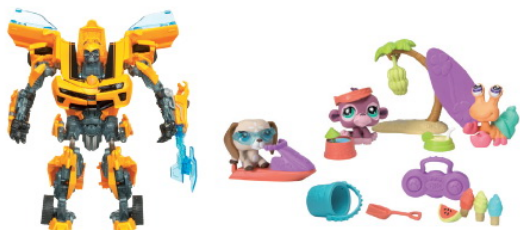
FIGURINES D'ACTION TRANSFORMERS - MINI UNIVERS LITTEST PET SHOP