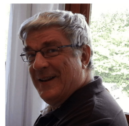
Ingénieur Grenoble INP, Directeur Technique Moldflow France